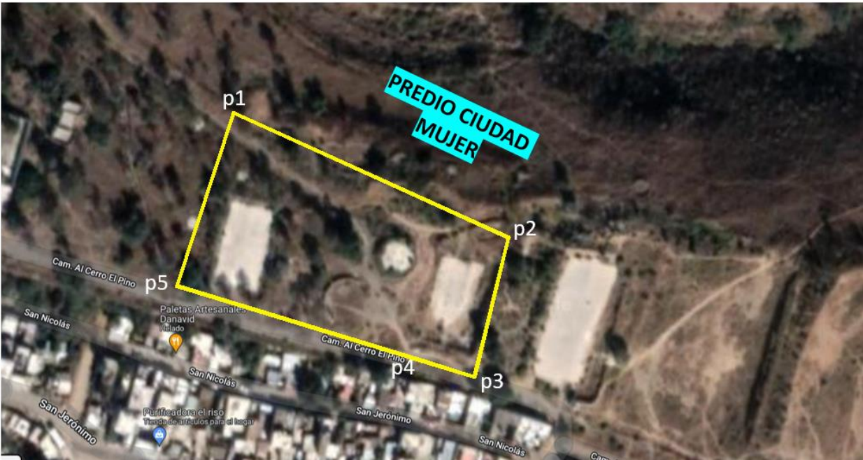
Imagen 2 Localización Geográfica del Proyecto